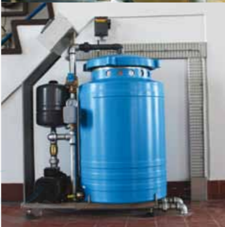
15 anlæg er monteret på Ejby Mølle